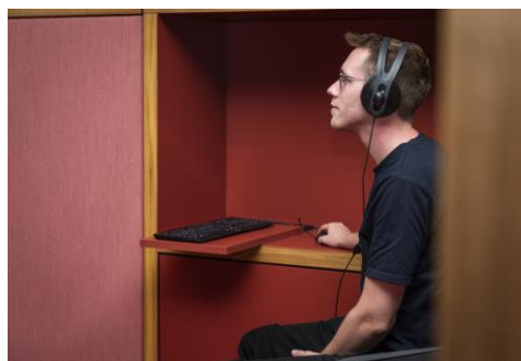
AV-Arbeitsplatz zum Hören und Schauen