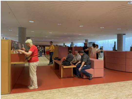
Blick in den Vinyl-Bereich der neuen Mediathek