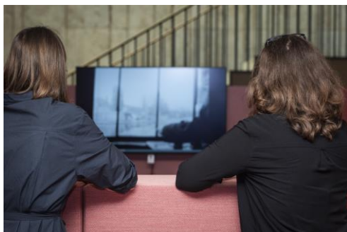
Stöbern in historischen Filmaufnahmen