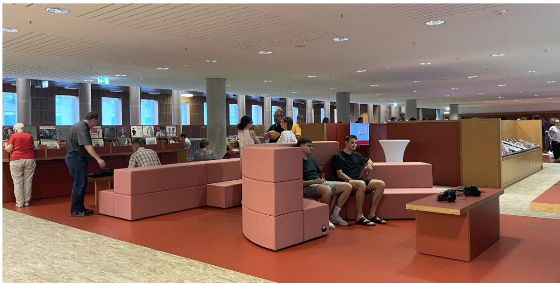
Blick in die neue SLUB Mediathek

Download in hoher Auflösung unter www.slubdd.de/bildermediathek