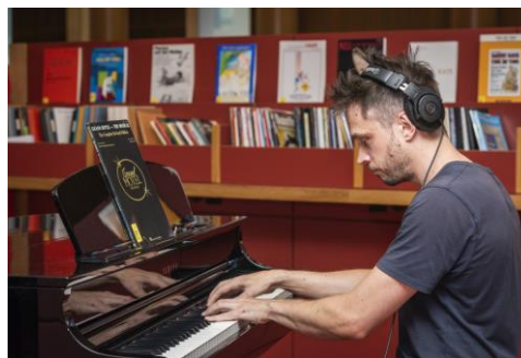
Am Silent-Flügel