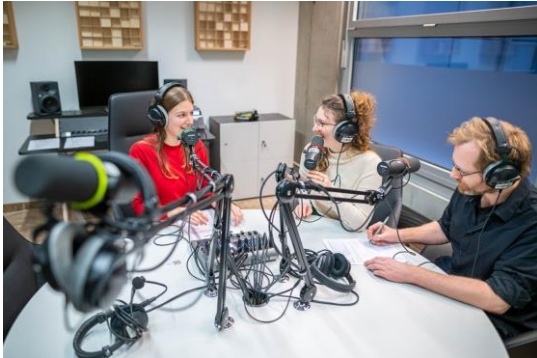
Offen für alle: Podcast-Studio in der SLUB Dresden