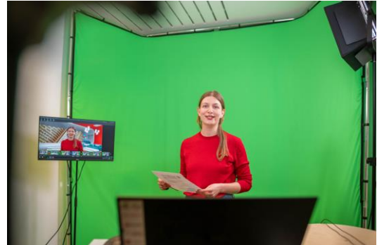
Im Greenscreen-Studio der SLUB Dresden