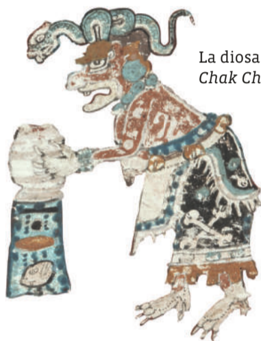
La diosa mayor Chak Chel